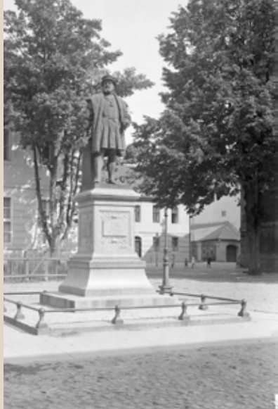
Dawny pomnik Jana z Kostrzyna

i z wyjątkową wprawą radził sobie ze sprawami wykraczającymi poza jego granice. Wśród tych spraw na czoło wysuwały się stosunki z jego bratem, księciem elektorem, z jednej strony, a z drugiej z biskupem z Lebus i zakonem joannitów, który w Nowej Marchii posiadał liczne dobra.”